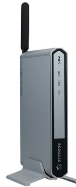
SS7000Ⅲ Pro（据え置き用品はオプション）